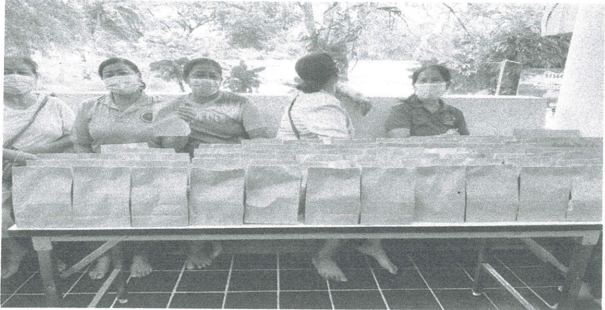
อาหารว่างประชุมโครงการส่งเสริมสุขภาพอนามัยแม่และเด็กลูกเกิดรอดแม่ปลอดภัย

ห้องประชุม โรงพยาบาลส่งเสริมสุขภาพตำบลบ้านหินฮาว