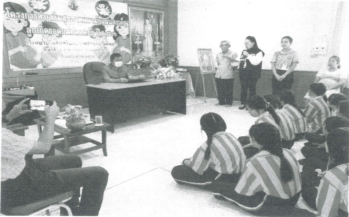
ผู้อำนวยการ รพ.สต. บ้านหินฮาว กล่าวรายงานแก่ประธานและผู้เข้าร่วมการประชุม

ห้องประชุม โรงพยาบาลส่งเสริมสุขภาพตำบลบ้านหินฮาว