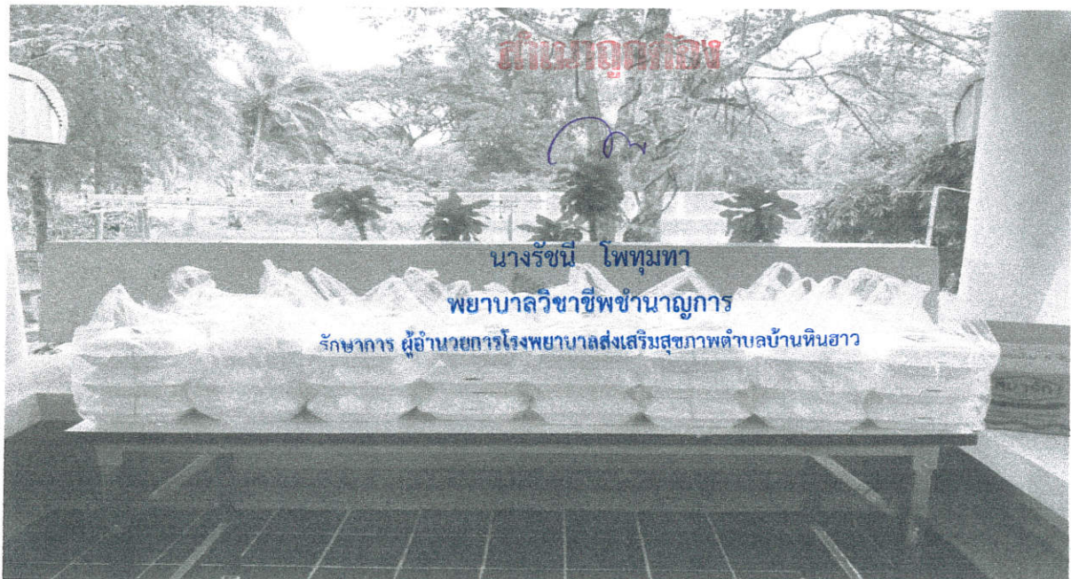
อาหารกลางวันประชุมโครงการส่งเสริมสุขภาพอนามัยแม่และเด็กลูกเกิดรอดแม่ปลอดภัย